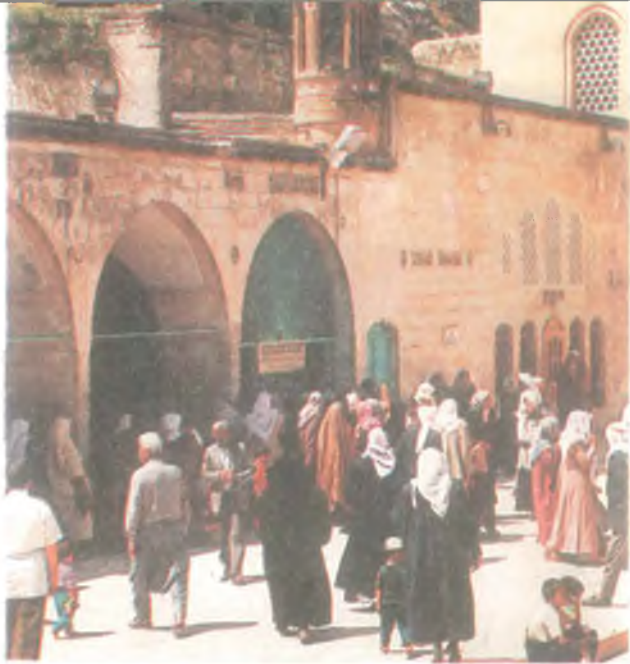
İbrahim Peygamberin Doğduğu Mağaranın Girişi