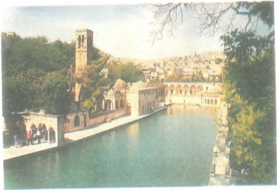
Halilürrahman Camii ve Gölü