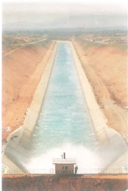
Harran Ovası Sulama Kanalları