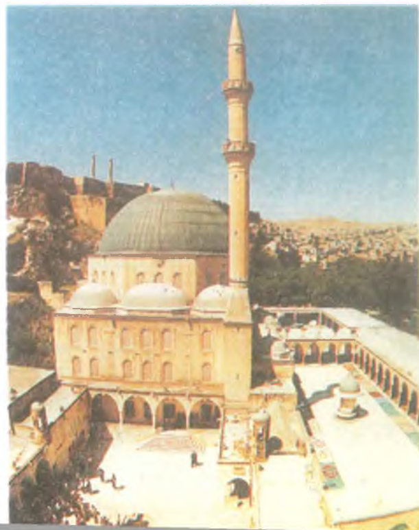
Mevlid-i Halil Camii