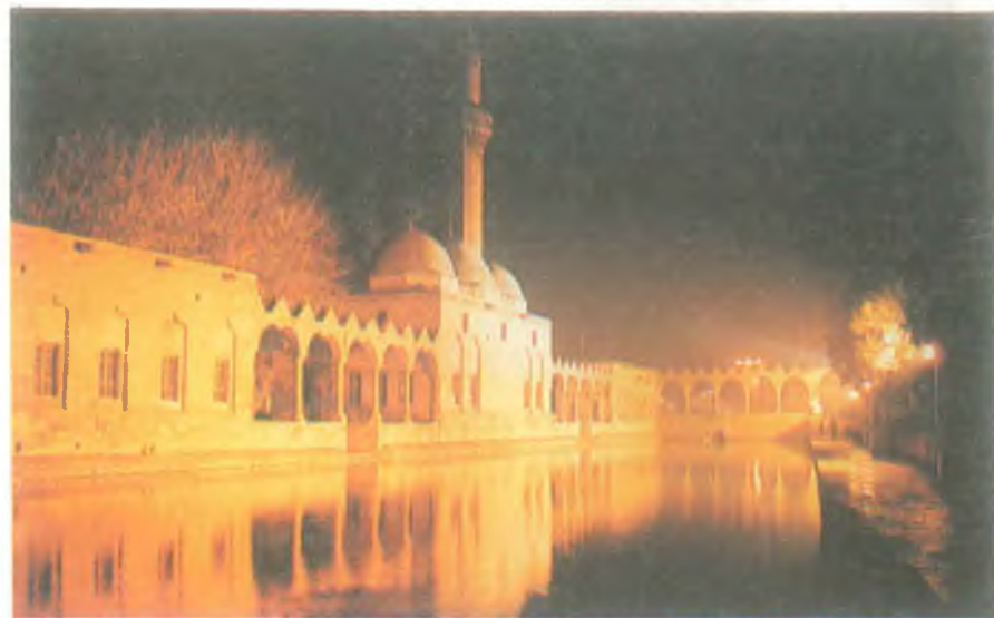
Halilürrahman gölü ve Rizvaniye Camii