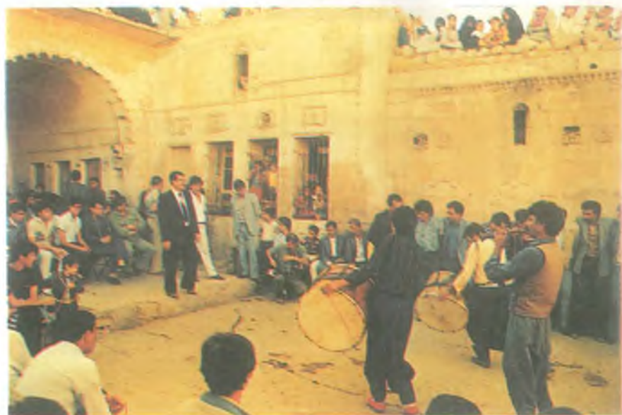
Urfa Evinde Düğün