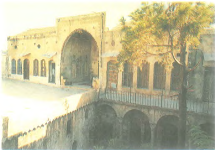
Tarihi bir Ufa Evi