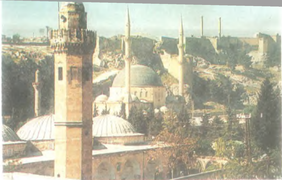
Hasan Padişah Camii, Yeni Dergah Camii ve Ş.Urfa Kalesi