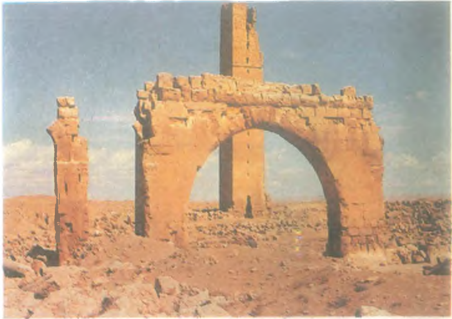
Harran Ulu Camii