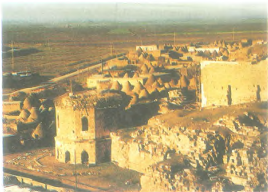
Harran Kalesi ve Harran evleri