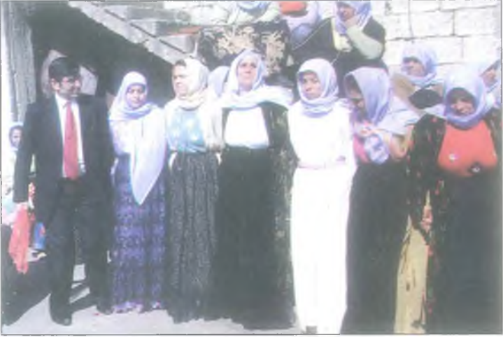
Urfa dgnnde halay ekmek baka olur.