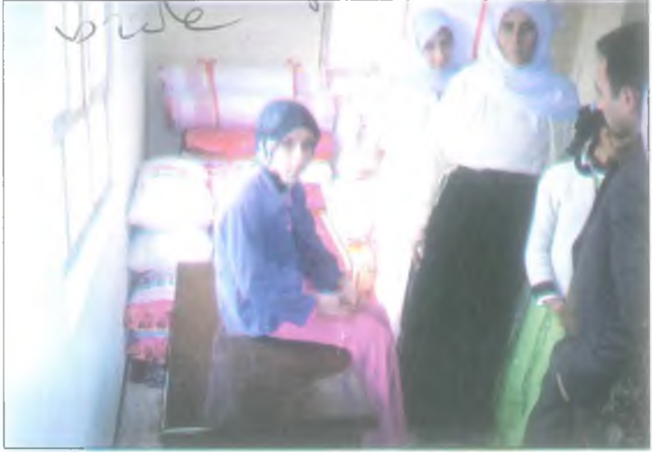
Ufra'da bir gelenektir gelinin kız kardeşi çehiz sandığının bahşinin alması.

kesimler koy duşğel m yükle vey mebeli kışın vüle