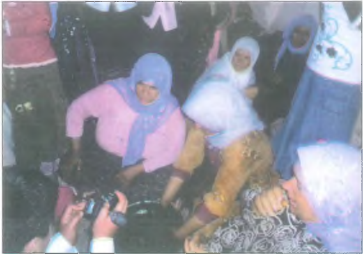
Çakmak çakmağa geldik kına yaklmaya geldik.