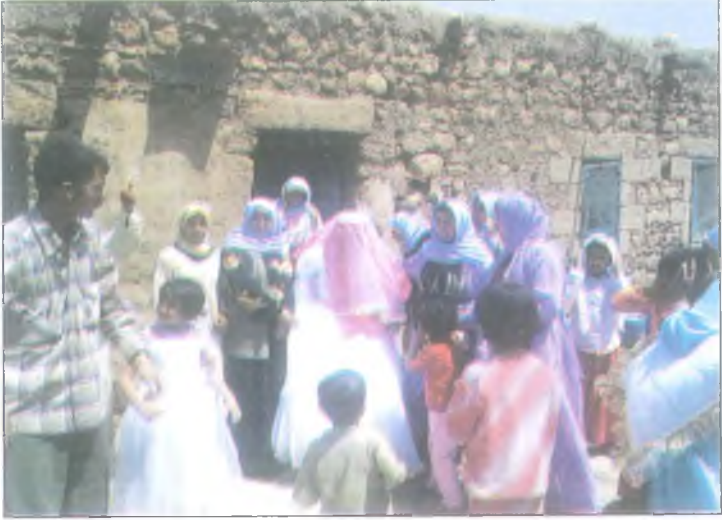
Baba ocağından ilk ayrılış.