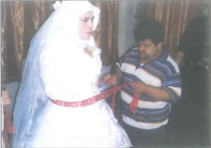
Gelinler evden ıkmadan nce erkek kardeinin gvencesi altındadır. Arkanda ben varım..