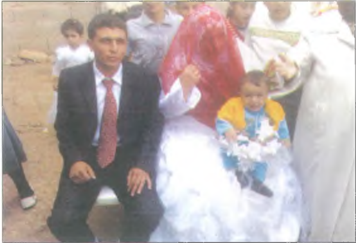
İlk çocuk erkek olsun diye oturan gelinin kucagina erkek bebek verilir.