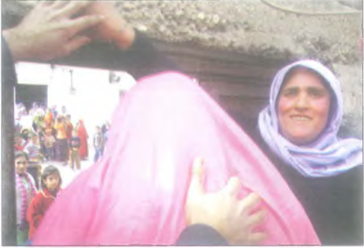
Kayın valideler ilk günde gelini emrine alır.