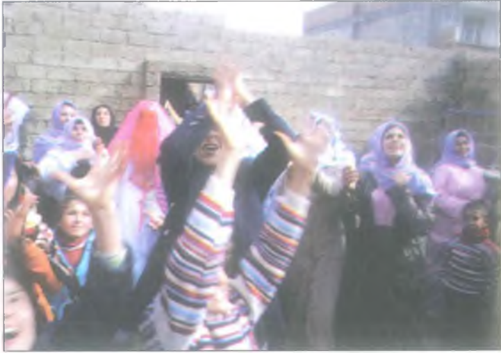
Tüm izdiham bi şeker kapabilmek için.