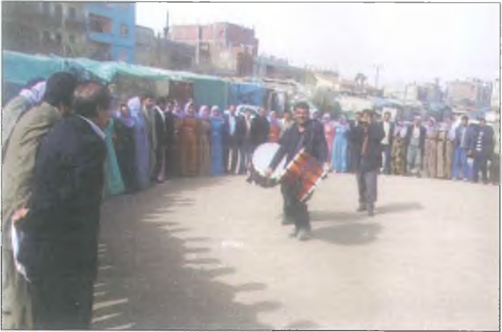
Aşiret düğününde kadın erkek omuz omuz.