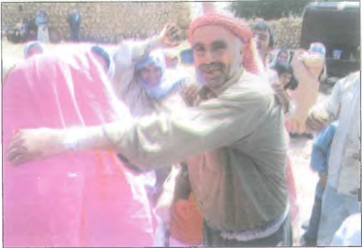
Hem ağlarım hem giderim veda anı.