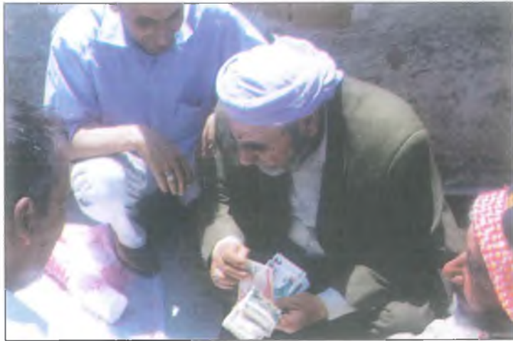
Urfa düğünlerinde sosyal dayanışmanın bir örneğidir savaş. (Para Toplama)