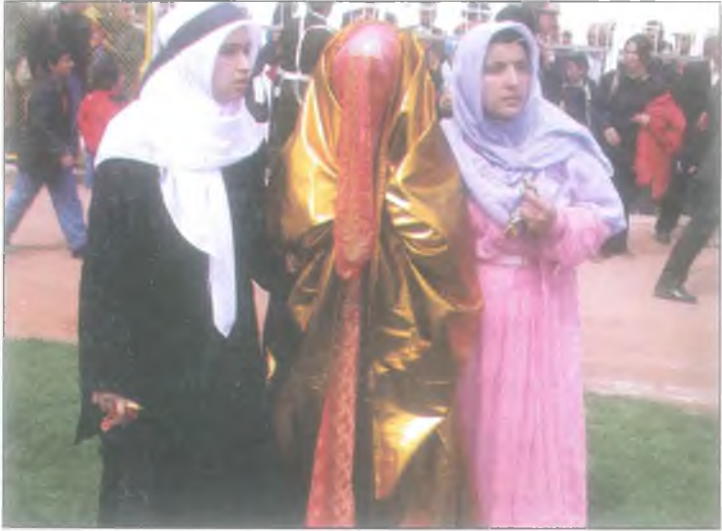
Düğünler her zaman ilgi odağı olmuş. Bir gösteri anı.