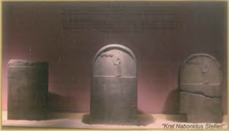
"Kral Nabonidus Stelleri"

MÖ 3.100 - MÖ 1.200 tarihlerini kapsayan, tunç madeninin kullanılmaya başlandığı, tekerleğin keşfedildiği, yazı, takvim ve matematiğin ilerlediği Tunç Dönemi'nde öne çıkan höyüklerimiz; Lidar Höyük, Tiriş Höyük, Kurban Höyük ve Gre Virike Höyük'tür. "Çocuk Lahdi", "Oyuncaklar" ve "Mezar Buluntuları" bu salonumuzda sergilenmekte olup, müzemiz koleksiyonunda ait en güzel pişmiş toprak eserleri bu salonda görmek mümkündür.