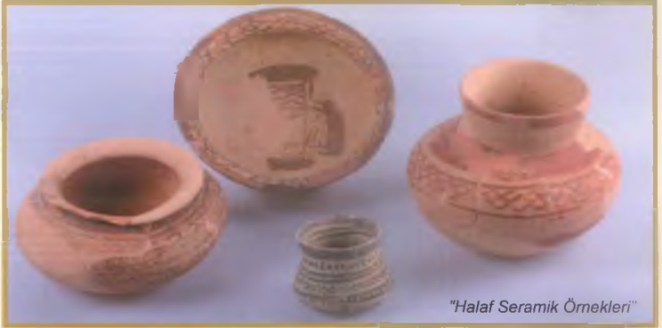
"Halaf Seramik Örnekleri"