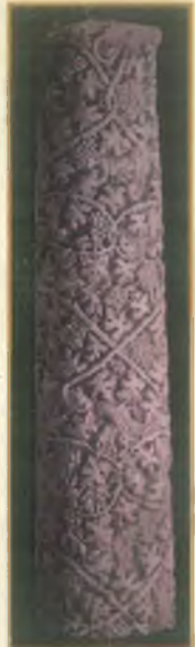
Asma Desenli Sütun

Yine Harran'da ele geçen Abbasi Dönemi "Raks Eden Figür" ve Lidar Höyükte ele geçen "Sgafitto" kâse, Şanlıurfa'da İslami Dönem 'in önemli buluntuları arasındadır.