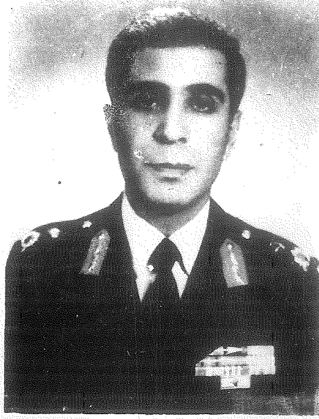
Tuğgeneral Hulusi ÇELİKPAZU Tuğay Komutanı