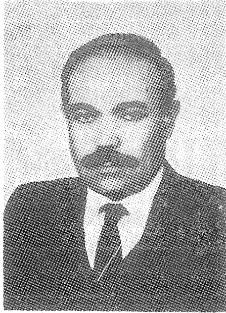
Alpaslan KARACAN Şanlıurfa Valisi