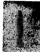
PIŞMIŞ TOPRAK FIGÜRLERİ