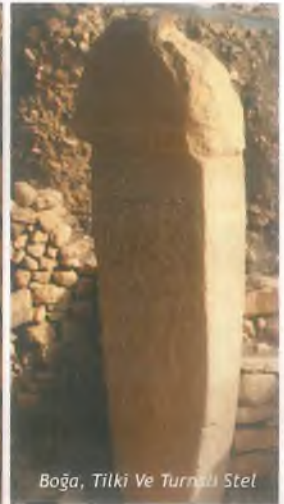
Boğa, Tilki Ve Turna Stel