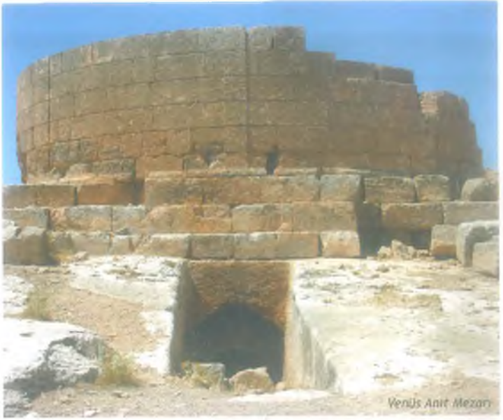
Venus Anıt Mezarı

Soğmatar kült yeri, özellikle MS 165 yıllarında Partların (İranlılar) Urfa bölgesine yaptıkları yoğun saldırılardan dolayı bölgeden kaçan halk tarafından kurulmuş ve İslam dönemine kadar kült merkezi özelliğini korumuştur. Soğmatar'da, Şuayb Şehri gibi su ihtiyacını karşılamak için ana kayaya oyulmuş su kuyuları bulunmaktadır. Soğmatar Antik Şehri'ndeki tarihi kuyunun Hz. Musa Kuyusu olduğu rivayet edilir.