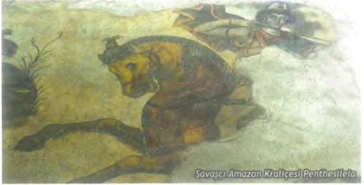
Savaşçı Amazon Kraliçesi Penthesilea

Haleplibahçe Mozaikleri’nin en önemli özelliği “Savaşçı Ama- zon Kraliçelerinin İsimleriyle Beraber Mozaïğe Resmedilmiş Dünyadaki Tek Örneği” olmasıdır. Uzmanlar, Haleplibahçe Mo- zaikleri’nin mozaik tekniği, sanatı, 4 mm 2 ebadında Fırat Neh- ri’nin orijinal taşlarından yapılması ve benzeri özelliklerinden dolayı, dünyanın en kıymetli mozaïği olarak tanımlamaktadır.