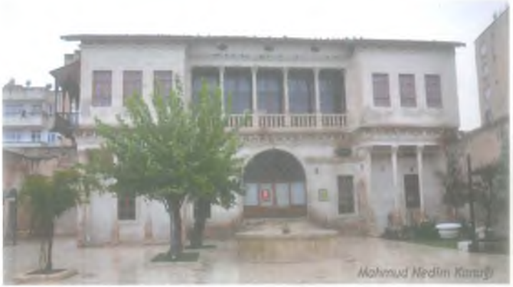
Mahmud Nedim Konağı

Eski Devlet Hastanesi yakınındadır. 1903 tarihinde inşa edilmiştir. Avrupai tarzda konak mimarisi ile geleneksel tarzda Urfa evi mimarisinin kaynaştığı bir özelliğe sahip olan ve oldukça geniş bir alana yayılan konak, haremlik ve selamlık bölümlerinden meydana gelmiştir. 1940'lı yıllarda Halk Tiyatrosu, bu binada gösteriler yapmıştır. Konak, Şanlıurfa Valiliği tarafından onarılmış ve 11 Nisan 2009'da "Şanlıurfa Kurtuluş Müzesi" olarak hizmete sunulmuştur. Konağın bir bölümü, Devlet Türk Halk Müziği Korosuna tahsis edilmiştir. Ayrıca konaktaki bir salon Müslüm Gürses Müzik Müzesi olarak düzenlenmiştir.