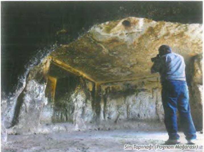
Sin Tapınağı (Pognon Mağarası)