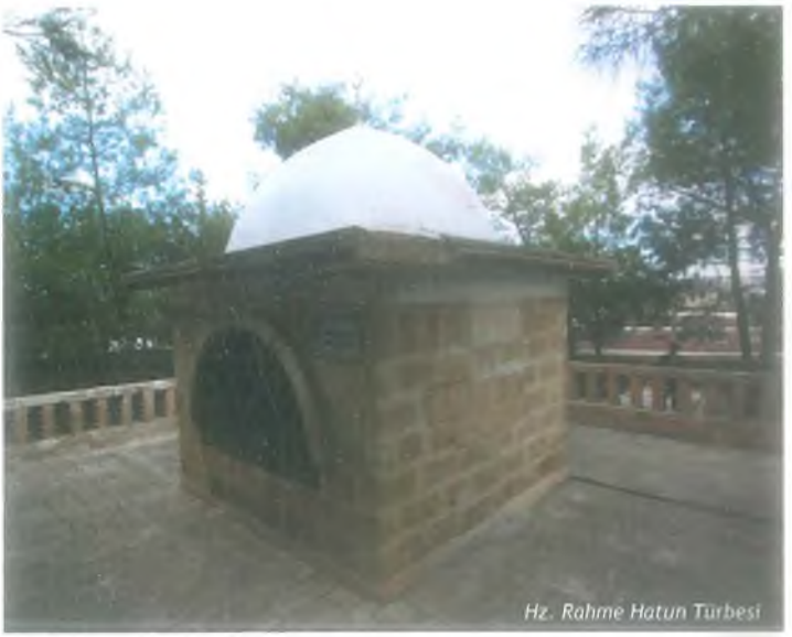
Hz. Rahme Hatun Türbesi