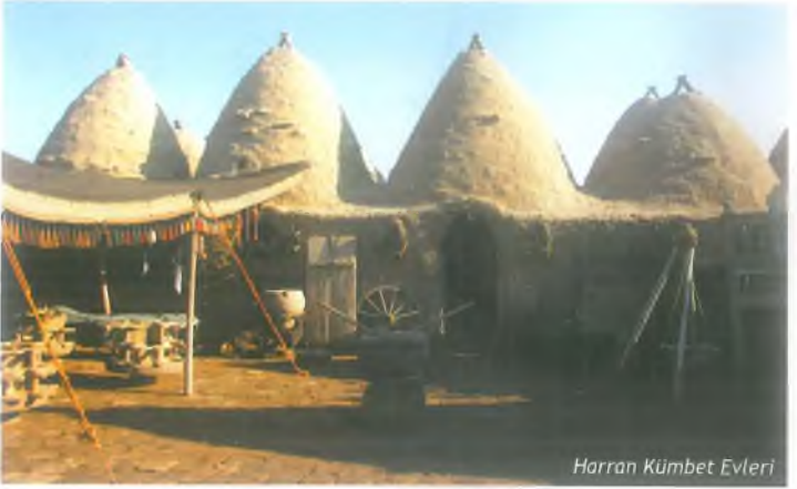
Harran Kümbet Evleri

Harran'la özdeşleşen kümbet evlerin (Konik Evler) büyük çoğunluğu hala mevcudiyetini korumaktadır. Bu evlerin benzerlerine, Şanlıurfa'ya bağlı Suruç ve Birecik kırsalındaki köylerde de rastlamak mümkündür. Ancak, Harran'daki evlerin diğerlerinden ayrılan bariz farkı, üst örtüsünde tuğla kullanılmasıdır. Harran'daki evlerinin tuğla ile örtülmesinin iki sebebi vardı: Biri, bölgenin çöl olmasından dolayı ağaç malzemenin bulunmaması, diğeri ise, Harran'da bol miktarda bulunan tuğla malzemedir. Evlerin yüksekliği içerden en fazla 5 metredir. Konik külahlar, 30-40 tuğla dizisi ile örülmüştür. Örgüleri düzensiz bir şekilde balçık sıva ile bağlanan üst örtü ve duvarlar, içerden ve dışarıdan yine bu harçla sıvanmıştır. Harran evleri bölge iklimine uyumlu olarak yazın serin, kışın sıcaktır.