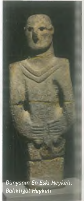
Dünyanın En Eski Heykeli: Balıklıgöl Heykeli

Şanlıurfa, il genelinde yapılan arkeolojik kazı sayısı ile Türkiye'nin en çok kazı yapılan ilidir. Bu bağlamda kent merkezi ve iki ilçe merkezi kentsel sit alanı ilan edilmiştir. Yani Şanlıurfa adeta "Açık Hava Müzesi"dir. Tüm bu özelliklerinden dolayı Kültür ve Turizm Bakanlığı Haleplibahçe'de biri arkeoloji diğeri mozaik müzesi olmak üzere iki adet müze yapılmasına karar vermiştir. Yeni Şanlıurfa Müzesi ve mozaikler için yapılan Haleplibahçe Mozaik Müzesi 24 Mayıs 2015 tarihinde hizmete girmiştir.