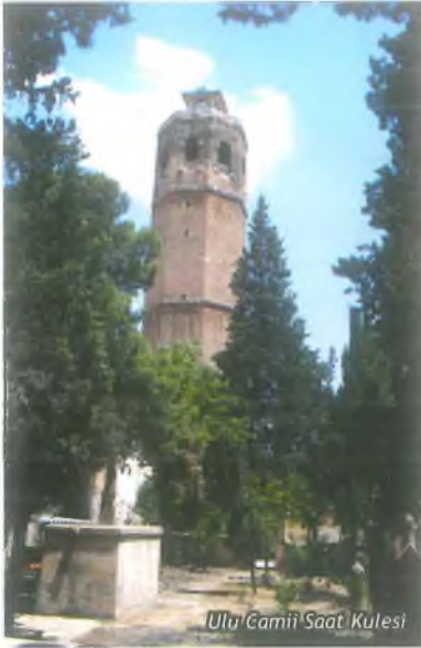
Ulu Camii Saat Kulesi

restore edilerek konukevi fonksiyonu verilen "Yıldız Sarayı Konukevi", Urfa'da konukevi ve restaurant olarak hizmet veren geleneksel Urfa evlerinin en büyüğüdür.