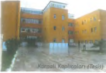
Karaali Kaplıcaları (Tesis)

54 daireden oluşan bir apart otel de Şubat 2000 'de hizmete açılmıştır. 49-55 derecedeki sıcak suyun, sinir sistemi, eklem, cilt, dolaşım ve benzeri hastalıklar için şifa özelliği taşıdığı tespit edilmiştir. Karaali Kaplıcaları, kaplıca turizmi dışında seracılık amaçlı da kullanılmaktadır.