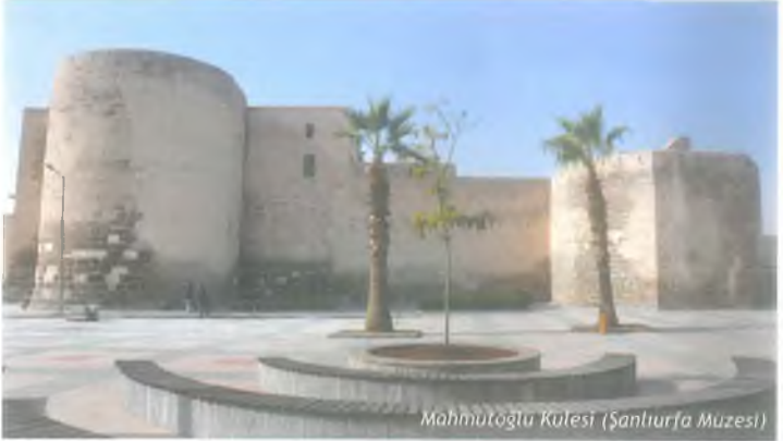
Mahmutoğlu Kulesi (Şanlıurfa Müzesi)

Beykapısı mevkiinde, Haçlı Kontluğu Dönemi'nde 19 Şubat 1122 - 18 Şubat 1123 arasında inşa edilmiştir. 2008 yılında Belediye Başkanı A. Eşref FAKIBABA döneminde kamulaştırılmış, 2011 yılında restorasyonuna başlanmıştır. Belediyemiz tarafından hazırlanan, Karacadağ Kalkınma Ajansı tarafından desteklenen "Mahmudoğlu Kulesi ve Doğu Surları Projesi" kapsamında Kule çevresindeki 24 ev ve iş yeri kamulaştırılmıştır. 2014 yılında restorasyon tamamlanmış ve yapı, Şanlıurfa Kent Müzesi olarak hizmete girmiştir.