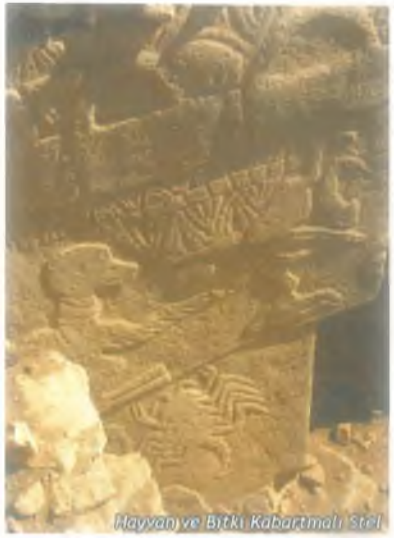
Hayvan ve Bitki Kabartmalı Stel

Anlaşılan o ki; gelecekte yapılacak kazılar, Göbeklitepe’nin kendine has birçok sırrı sakladığını ortaya çıkaracaktır.