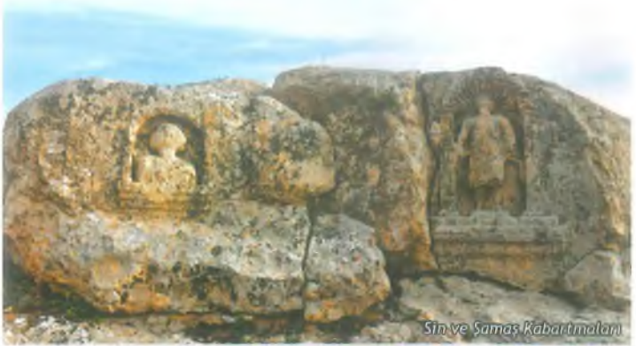
Sin ve Şamaş Kabartmaları

Eyyubiye ilçemize bağlı olan Soğmatar Antik Şehri idari olarak Harran ilçe sınırları içine girmese de Harran-Eyyubnebi turizm yolu güzergâhında olduğu için burada işlenmektedir. Şuayb Antik Şehri'nden 18 km. sonra, Soğmatar Antik Şehri'ne varılır. Burası, Harran'a 57 km. mesafededir. Roma Dönemi'ne (MS 2. yüzyıl) tarihlenen bölgenin, Abgar Krallığı döneminde Harranlıların Tektek Dağları bölgesinde; ay ve gezegen tanrıları için tapındıkları bir kült merkezi olduğu kabul edilmektedir. Soğmatar kült yerinde; Ay tanrısı Sin'e tapınılan bir mağara (Pognon Mağarası), yamaçlarında yer yer tanrı kabartmalarının ve zemine kazılmış yazıtların olduğu bir tepe (Kutsal Tepe), 6 adet kare ve yuvarlak planlı mozole (anıt mezar), iç kale ve ana kayaya oyulmuş çok sayıda kaya mezarı bulunmaktadır.