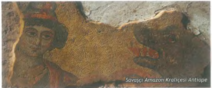
Savaşçı Amazon Kraliçesi Antiope

Haleplibahçe’de Şanlıurfa Valiliği imkânlarıyla Şanlıurfa Arke- oloji Müzesi Başkanlığı’nda ve arkeologlarımızın nezaretinde, ilk etapta 100 m 2 ’lik mozaik gün ışığına çıkarılmıştır. Av sah- nesi mozaïğinin kenar bordürlerinde, geometrik motifler, bit- ki desenleri, güvercin, kanatsız eros, sincap, ördek, keklük, ceylan ve tazi figürlerine yer verilmiştir. Mozaïği çevreleyen bordürün köşelerinde ise “Edessa Güzeli” diye kamuoyuna yan- sıyan, mask dışında, ana sahnede dört amazon kraliçesi Hippol- yte (Hiplüte), Antiope, Melanipe (Melanipe) ve Penthesileia (Pentesileya) savaşçı amazon kadınlara özgü giysileriyle tek göğüslü olarak at üstündeki av sahneleri tasvir edilip Grekçe isimlerine yer verilmiştir.