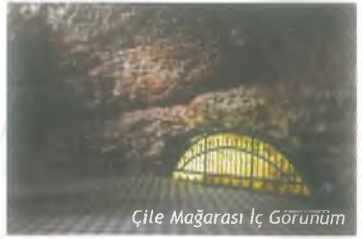
Çile Mağarası İç Görünüm