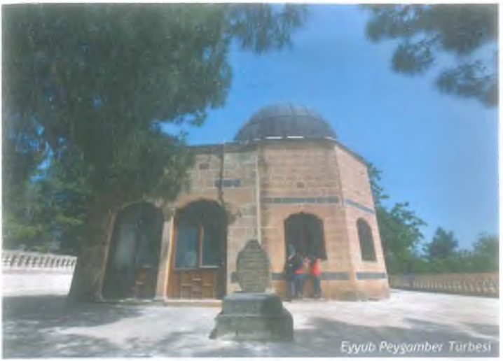
Eyyub Peygamber Türbesi

sahibi olmuştur. İmtihan öncesi sahip olduğu zenginliğe fazlasıyla sahip olmuştur. Hz. Eyyûb (a.s.)'un 93, bir başka görüşe göre 164 yaşında vefat ettiği rivayet edilir. Hz. Eyyûb (a.s.) Eyyüpnebi Beldesi'ne defnedilmiştir.