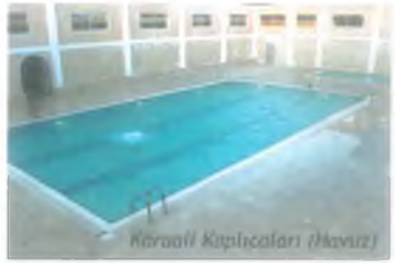
Karaali Kaplıcaları (Havuz)