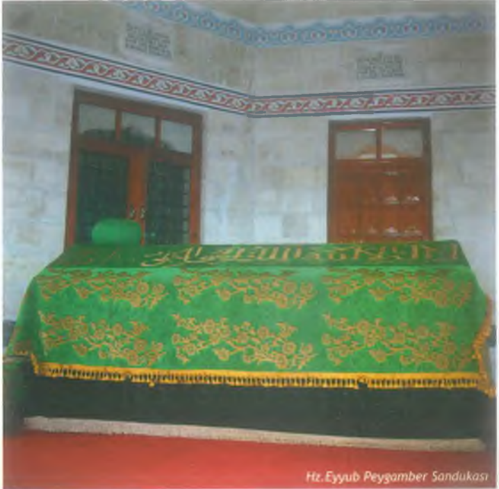
Hz. Eyyub Peygamber Sandukası

sahibi olmuştur. İmtihan öncesi sahip olduğu zenginliğe fazlasıyla sahip olmuştur. Hz. Eyyûb (a.s.)'un 93, bir başka görüşe göre 164 yaşında vefat ettiği rivayet edilir. Hz. Eyyûb (a.s.) Eyyüpnebi Beldesi'ne defnedilmiştir.