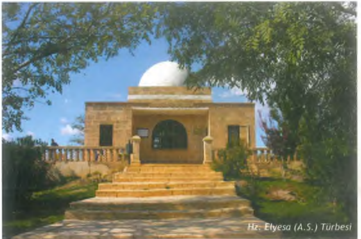
Hz. Elyesa (A.S.) Türbesi

Hz. Elyesa (a.s.) Hz. Eyyûb'un çağdaşıdır. Rivayete göre; Şam diyarından göç ederek Hz. Eyyûb (a.s.)'u görmeye gelen Hz. Elyesa, Eyyüpnebi Köyü'ne vardığında yoluna şeytan çıkar, yaşlı bir insan kılığında Hz. Elyesa'ya görünür ve O'na "Ey yaşlı insan boşuna yorulma Eyyûb'u bulamazsın, O buralardan göç etti çok uzaklara gitti bu yaşlı halinle O'nu bulman mümkün değil" diyerek Hz. Elyesa'yı kandırır. Hz. Elyesa artık yaşlanmıştı yürüyecek gücü kalmamıştı, hemen oracıkta Rabbine sığınarak ruhunu teslim almasını niyaz eyler. Duası kabul olur. Hz. Eyyûb (a.s.) türbesinin güneybatısında köye 500 metre kadar mesafedeki makam Hz. Elyesa (a.s.) Türbesi olarak bilinmekte ve asırlardır Hz. Elyesa makamı olarak ziyaret edilmektedir.