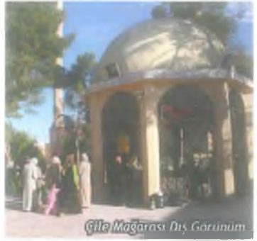
Çile Mağarası Dış Görünüm

Cenâb-ı Hakk, sevgili kulu Hz. Eyyûb'un duasını kabul eder. Topuğunu yere vurmalarını, çıkacak olan su ile yıkanmasını ve bu soğuk suyu içmesini emr eyler. Hz. Eyyûb emr-i İlâhî'yi yerine getirir ve vücudunun hem içini, hem dışını onunla temizler. Böylece hastalıklardan kurtulur. Şifalı Kuyu'nun 150 metre kadar batısındaki kalıntıların altında kayalardan oyulmuş bir hamam olduğu, bu hamamda cüzamlı hastaların ve romatizma hastalıklarının tedavisinin yapıldığı yazılı ve sözlü kaynaklarda belirtilmektedir.