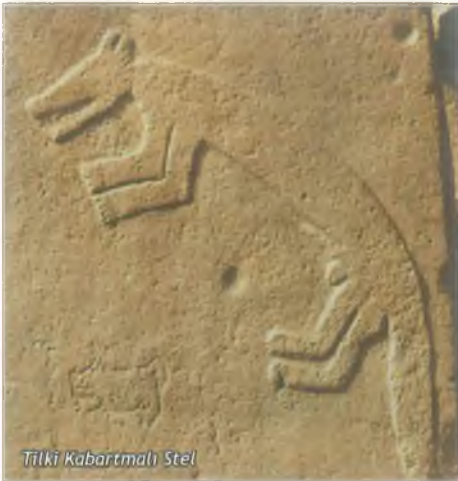
Tilki Kabartmalı Stel