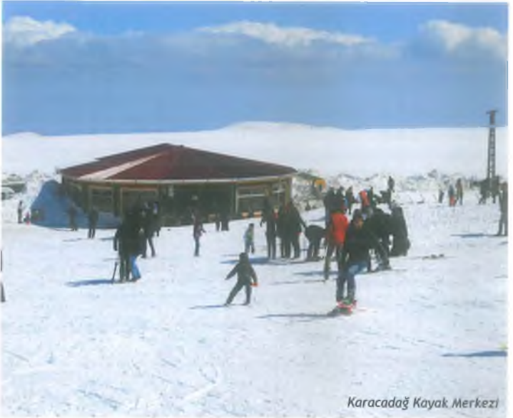
Karacadağ Kayak Merkezi

Şanlıurfa sınırları içinde kar tutan ender yerlerden olan Karacadağ'da Valilik tarafından kayak pistleri düzenlenmiştir. 600-700 m. uzunluğunda pistler için 250m'lik bir lift yapılmıştır. Siverek ilçemize 60 km. mesafede olan kayak merkezinde 60 m 2 'lik bir kafeterya ile 30 m 2 'lik bungalov tipi hizmet evi bulunmaktadır. Kasım ayından itibaren dört aylık kayma sezonu vardır.