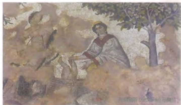
亚马逊女战士希伯利特 (Hippolyte)