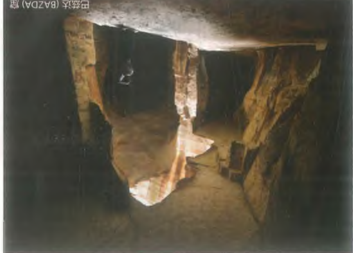
巴兹达 (BAZDA) 窟

巴兹达窟在快速公路行驶19公里后,公路两侧有着古采石场。巴兹达窟在快速公路行驶19公