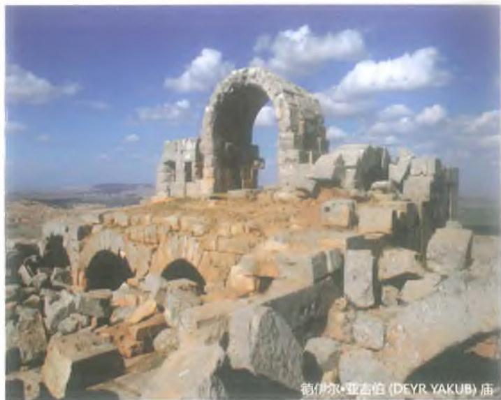
德伊尔·亚古伯 (DEYR YAKUB) 庙

德伊尔·亚古伯庙在乌尔法中心10公里左右,位于南山上。据传说,该建筑被亚伯拉罕否定信仰的古代国王尼姆鲁特·本·柯南 (Nemrut Bin Ken'an) 作为避暑别墅。因此,此地区的建筑又称为“姆鲁特的王座”或“精灵踏车”。位于庙西北的墓碑上有着一个墓志铭。墓志铭第一行是用古希腊文写的。墓志铭第二行是用帕尔米拉(Pamyra)叙利亚文写的。该墓志铭算是属于公元2世纪末或公元3世纪初。德伊尔·亚古伯庙估计建于公元2世纪末或公元3世纪初。