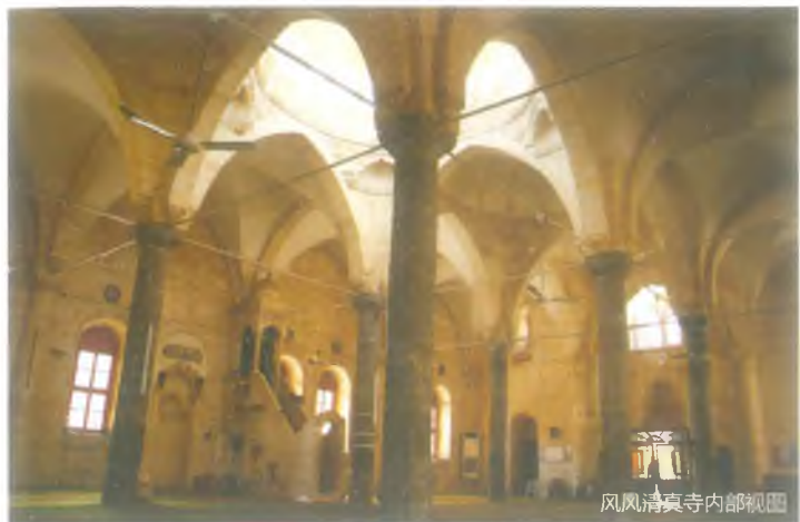
风风清真寺内部视图