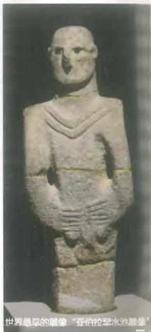
世界最早的雕像“亚伯拉罕水池雕像”

尚勒乌尔法市是考古出土数量最多的城市之一。所以在市区及两个县内被建立了考古发掘现场。从这个方面来说,尚勒乌尔法是一座露天博物馆。由于这些原因,土耳其共和国文化旅游部决定在哈勒颇花园建立两座博物馆,被称为哈勒颇花园马赛克博物馆和尚勒乌尔法考古博物馆。哈勒颇花园马赛克博物馆及尚勒乌尔法新考古博物馆已于2015年5月24日正式开馆。