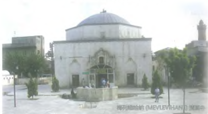
梅列维哈纳 (MEVLEVİHANE) 清真寺

梅列维哈纳清真寺位于海世米业 (Haşimiye) 广场东, 建于18世纪。该建筑为马拉维教团建立, 称为梅列维哈纳。修道院被关闭之后, 改为清真寺, 落成向公众开放。该建筑已被基金会理事局修复。该清真寺设有一个正方形, 该建筑上有一座塔。清真寺的西边有集市, 原称卡萨普拉尔(Kasaplar)集市。在土耳其征地制度下, 该集市被改为纪念品集市。