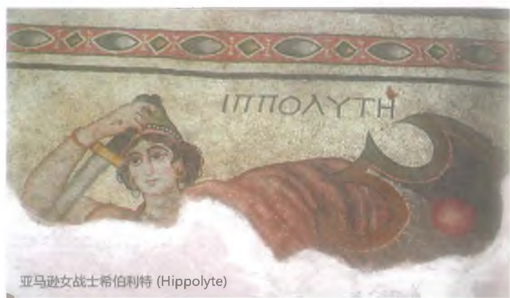
亚马逊女战士希伯利特 (Hippolyte)

考古专家在哈勒颇花园中发现了各种各样的马赛克画。这些马赛克画之间特洛伊(Truva)战争的一个半神英雄阿喀琉斯(Achilles)的马赛克画是十分重要的。被尚勒乌尔法博物馆考古专家考古发掘的这副马赛克画描绘了阿喀琉斯的生活。此外,考古专家在哈勒颇花园中出土了古罗马温水浴室。