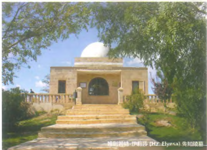
哈则若特·伊莉莎 (Hz. Elyesa) 先知陵墓

埃尤普先知与伊莉莎先知是那一代人。据传说,伊莉莎先知从大马士革移民后,想去拜访埃尤普先知。到了埃尤普纳比 (Eyyüpnebi) 县之后,她遇到了魔鬼,附体在老人身上。魔鬼对他说:“哎,老爹啊。你不为他浪费时间。你不能找到埃尤普。他已经移民到别的地方。你已经老了。真的不能找到他。”伊莉莎先知信魔鬼的话。他已经老了,真的没有力气走路。因此,他即做礼拜,恳求安拉给他死。安拉回应了他的祈求。他死在那里。伊莉莎先知陵墓位于埃尤普先知陵墓西南边(从埃尤普纳比县到村之间大约500米的距离)。该陵墓又称为伊莉莎先知木卡姆。数千年以来,伊莉莎先知木卡姆被公民拜访。