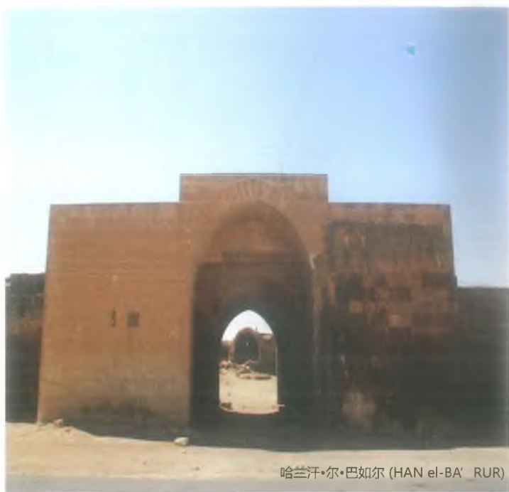
哈兰汗·尔·巴如尔 (HAN el-BA' RUR)

里右侧。巴兹达又称为“尔巴兹杜(Albazdu)”、“尔巴兹得(Elbazde)”或“搏兹达(Bozdağ)窟”。石上刻的阿拉伯碑文上写着：“13世纪，是由阿卜杜勒拉赫曼·尔·哈卡里 (Abdurrahman el-Hakkâri)、穆罕默德·伊本·巴基尔 (Muhammet ibn-i Bakır)、穆罕默德·尔·乌扎尔 (Muhammed el- 'Uzzar) 管理这家采石场的。为了建造哈兰、汗·尔·巴如尔及叔艾布 (Şuayb) 的建筑，从采石场上捡了石头。因此，两个窟内有着许多坑道及隧道。