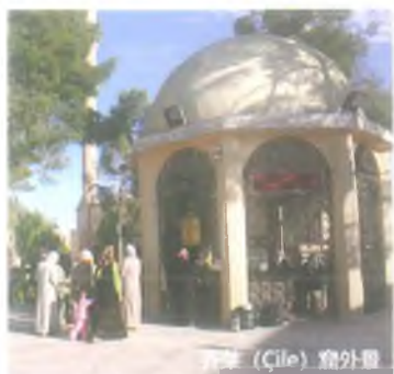
拜罕 (Çile) 窟外景

后来,他妻子回村去。不过她还是带着饭去看她老公。可是埃尤普的病情越来越重。他人体的寄生虫在他体心脏中开始繁殖,于是为他身体得医治向安拉祷告。安拉回应了他的祈求,命令他:“你跳脚跟到地上。跳脚之后,地面上的脚印里渗出水来。你用泉水洗澡。洗澡之后把水喝下去。”埃尤普先知完全地执行安拉的命令。他首先跳了脚跟在地上。地面上有冷水渗出来了。埃尤普先知把这冷水喝下去了,用这冷泉水洗澡好。因此,泉水治好了重病。治疗泉水并向150米西侧有石浴室。按照记载,用这坐浴室的水为人治好病(麻风病、风湿病等)。