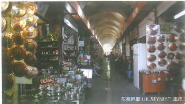
忽赛尼耶 (HUSEYNIYE) 集市