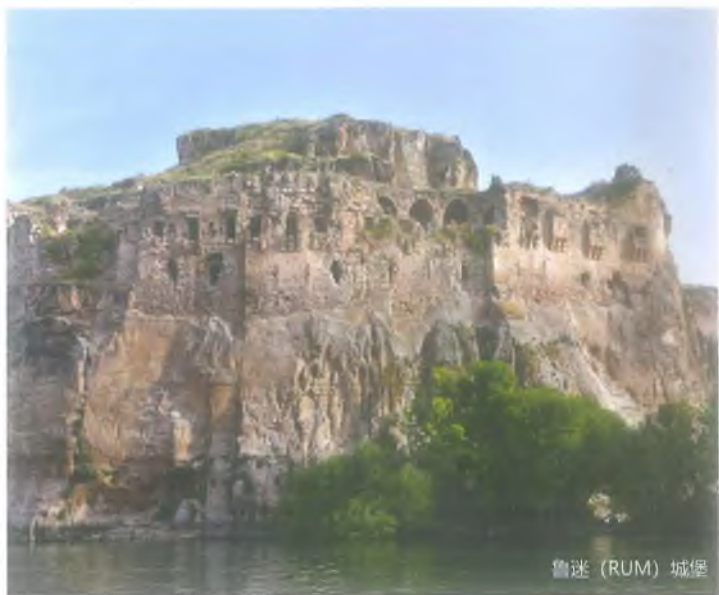
鲁迷 (RUM) 城堡

鲁迷城堡位于比雷吉克(Birecik)高原北边,在幼发拉底河岸上的山上。12世纪,鲁迷城堡被作为亚美尼亚天主教中心。1292年,该城堡已被马穆鲁克苏丹梅利克·尔·艾世乳富(Melik el-Eşref) 侵略。1516年,达比克草原 (Merçidabik) 战争之后,鲁迷城堡国土被奥斯曼帝国吞并。鲁迷城堡属于哈尔费蒂县。鲁迷城堡必须去的旅游景点是城堡、圣纳尔瑟瑟(Nerses) 教堂以及巴尔沙玛 (Barşavma) 寺院。