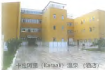
卡拉阿里 (Karaali) 温泉 (酒店)