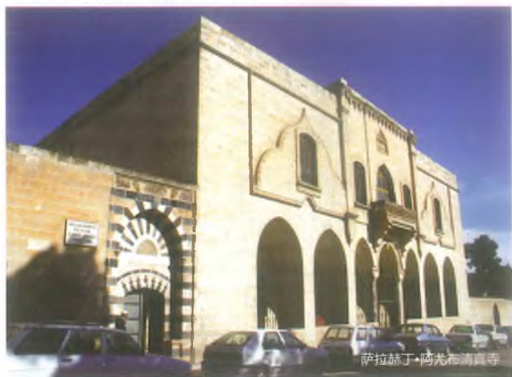
萨拉赫丁·阿尤布清真寺

该清真寺位于瓦里·福啊特·贝 (Vali Fuat Bey) 街。原教堂由主教诺纳(Nona)建于457年,称为施洗叶海亚(Yahya)教堂。后来,19世纪又在施洗叶海亚教堂上增建了圣伊奥尼斯·普罗德罗莫斯教堂。该教堂是这一时东部地区中最大的教堂。因此被称为主教座堂。随着该建筑遭到冷落,改为发电站。修建于1993年5月28日的教堂改为清真寺后,正式开馆。该清真寺西边正面是主要的入口。原教堂的前厅重建后改为该清真寺的前厅。清真寺内各面窗户敞通明亮。该建筑窗台上属于原教堂的半柱及双龙压花。建于457年的原教堂第一次被萨拉赫丁·阿尤布(Selahaddin Eyyubi)用作清真寺。因此修建后,该建筑被称为萨拉赫丁·阿尤布清真寺。2010-2011年,清真寺已被基金会理事局修建。