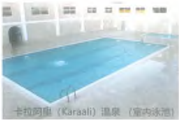
卡拉阿里 (Karaali) 温泉 (室内泳池)