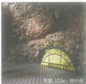
拜罕 (Çile) 窟内景