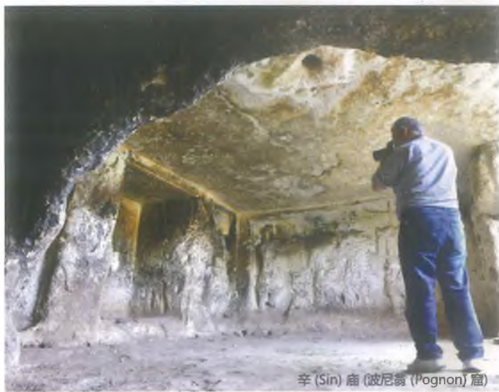
辛 (Sin) 窟 (波尼翁 (Pognon) 窟)