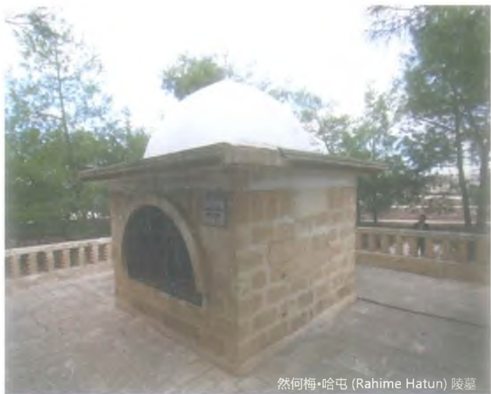
然何梅·哈屯 (Rahime Hatun) 陵墓