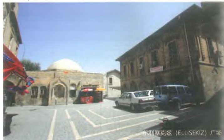
尔利塞克兹 (ELLİSEKİZ) 广场

霍希勾日广场位于尼梅图喇(Nimetullah)区。霍希勾日广场之所以是尚勒乌尔法市的最重要广场之一,是因为在属于奥斯曼时期尼梅图喇区的四条路上有著名的历史建筑。这格广场的南边有古图鲁斯(Kurtuluş)小学(努沐内(Numune)学校, 19世纪末); 东边有沙伊赫·萨费特 (Şeyh Saffet) 伊斯兰小屋 (1892)、沙伊赫·萨费特喷泉(Şeyh Saffet, 1891)、穆罕默德·穆赫易丁 (Muhammet Muhyiddin) 陵墓; 北边有若吉 (Reji) 教堂(1861); 西北边有尼梅图喇 (Nimetullah) 清真寺, 建于15世纪。因此, 这个广场被称为霍希勾日(Hoşgörü, 意思是心眼) 广场。