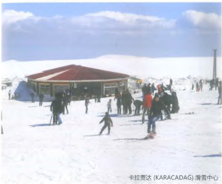
卡拉贾达 (KARACADAG) 滑雪中心

卡拉贾山是尚勒乌尔法市下雪的地方之一。尚勒乌尔法省政府在卡拉贾山上构建一个雪道。道长有600-700米，并建有一部250米的电扶梯。该滑雪中心距离锡韦雷克 (Siverek) 县大约60公里。卡拉贾山滑雪中心有着一座60平方米的咖啡馆及一座30平方米的民宿。该滑雪场基本上要到11月才能开放，一直持续到来年2月底。