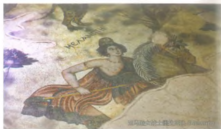
亚马逊女战士墨兰妮佩 (Melanippe)