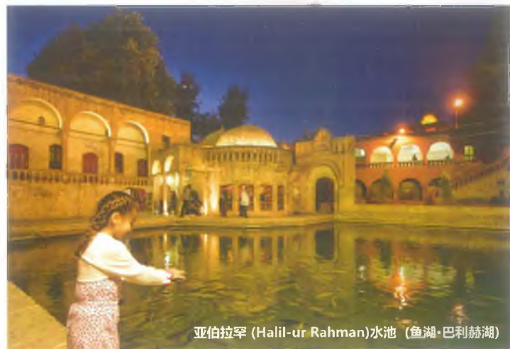
亚伯拉罕 (Halil-ur Rahman)水池 (鱼湖·巴利赫湖)

亚伯拉罕水池位于乌尔法城堡北边。这个池是亚伯拉罕被扔进大火中的地方。公元前2000年,亚伯拉罕否定信仰此地区的古代国王尼姆鲁特·本·柯南 (Nemrut Bin Ken' an)。他因亲手捣毁本族人供奉的所有偶像,并故意砸毁其中最大的一尊偶像所为,而被族人投入烈火中,那火中突然喷发出大水,亚伯拉罕为安拉所救,安然脱险逃走。这水变成了玫瑰花园。大家口口相传亚伯拉罕的传说,被亚拉伯罕的宗教教徒接受宗教信仰。