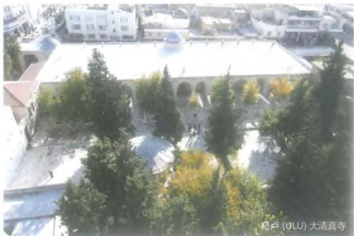
乌卢 (ULU) 大清真寺

据传说,耶稣送给国王的手帕放在水井里。因此,这座清真寺的水被市民视为“治疗疾病的奇迹之水”。共和国时期,该清真寺光塔上加建一座钟塔之后该清真寺改为钟塔。这坐建筑是乌尔法市唯一的钟楼。