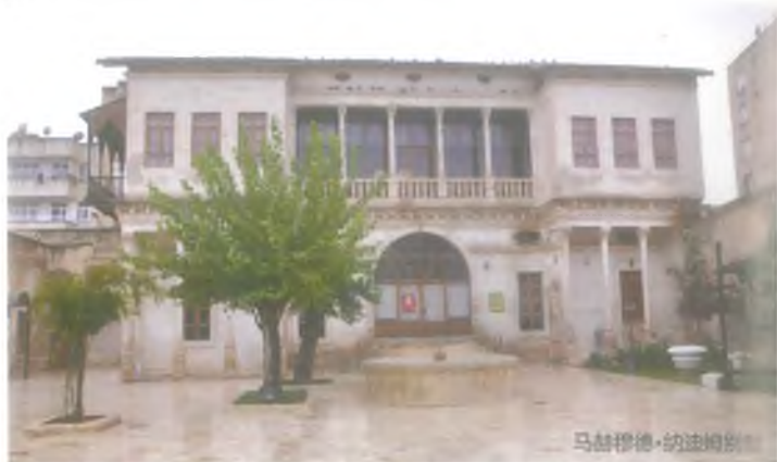
马赫穆德·纳迪姆别墅

离旧公立医院近。建于1903年。该别墅从建筑风格上大致有欧式别墅与传统乌尔法房屋的别墅建筑风格。别墅占地面积很大,主要由闺房室与内男子居住部分两大部分组成。1940年,人民剧院在这幢别墅演出。尚勒乌尔法省政府对马赫穆德·纳迪姆别墅进行了维修。2009年4月11日,别墅被改建成尚勒乌尔法古图鲁斯博物馆,正式开馆。别墅一部分分配给土耳其民间音乐合唱团。此外,博物馆内还设有穆斯林·故尔斯斯 (Müslüm Gürses) 音乐博物馆。