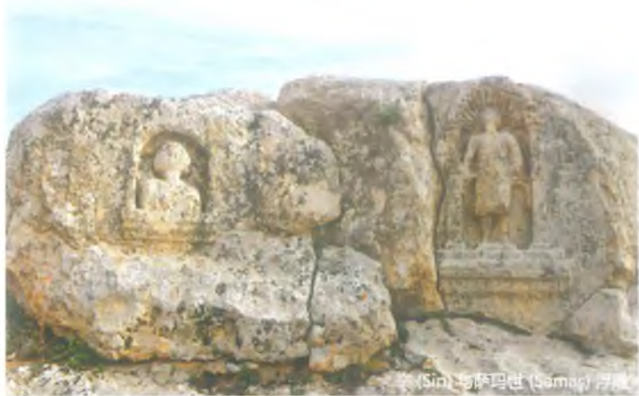
辛 (Sin) 与萨玛世 (Samag) 浮雕

索莫塔古城位于艾禹比耶 (Eyyubiye) 县。该古城并不在哈兰县境内,但位于哈兰-埃尤普纳比 (Eyyüpnabi) 旅游景点线。从叔艾布 (Suayb) 古城到索莫塔 (Sogmatar) 古城之间的距离大约有18公里左右。从哈兰县到索莫塔古城之间大约57公里的距离。该古城建于公元2世纪(罗马时期)。阿布格尔 (Abgar) 王国时期, 位于哈兰县特克·特克 (Tektek) 山区域的古城被市民作为崇拜中心。索莫塔宗教中心内有着月神辛 (Sin) 窟(波尼翁 (Pognon) 窟)及神山, 在山坡上发现了着神浮雕、碑铭、6个方形及圆形墓碑(纪念碑)、内堡及多数的石墓碑。