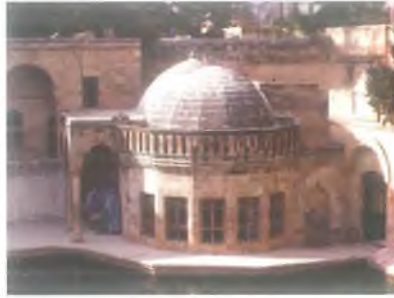
Halil-ür Rahman Medresesi Halil-ür Rahman Madrasah

The namazgah(the indoor venue where the namaz ritual can be performed) which is located on the western part is believed to be the point where Abraham -who lived around 2000 B.C.- has fallen down when he has been thrown to the flames of the big fire. The water inside the place which falls down as a fountain is believed to be holly and curative.