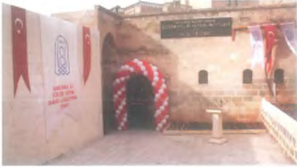
Geleneksel El Sanatları Müzesi ve Satış Merkezi

Geleneksel Urfa mimarisini yansıtan bu ev, 1992 tarihinde Şanlıurfa Valiliği tarafından satın alınarak restorasyonu yapıp "Taziye Evi" olarak hizmet vermiş, 2010 yılında Şanlıurfa Kültür Eğitim ve Araştırma Vakfı (ŞURKAV) tarafından, yeni bir düzenleme yapılarak, 24/01/2011 tarihinden itibaren ŞURKAV Geleneksel El Sanatları Müzesi olarak hizmet vermeye başlamıştır.