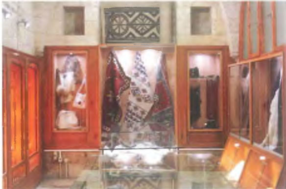
Satış Merkezi Teşhir Salonu

Presenting the traditional characteristics of Urfa architecture, this building was acquired and restored by the Governorship of Sanliurfa in 1992 and was opened to serve as "Condolence House". In 2010 there has been made a new regulation by SURKAV (Sanliurfa Culture, Education and Research Foundation) and it was opened on 24 January 2011 to serve as SURKAV Museum of Traditional Handcrafts.