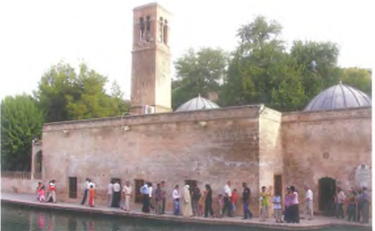
Halil-ür Rahman Camii (Döşeme Camii) / Halil-ür Rahman Mosque (Doseme Mosque)