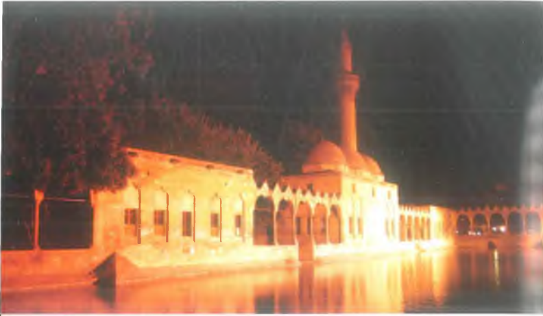
Rızvaniye Camii / Rızvaniye Mosque

Rakka Valisi Rıdvan Ahmet Paşa tarafından 1736 (Hicri.1149) yılında yaptırılmıştır. Harim giriş kapısı iki renkli malzeme kullanılarak yapılmıştır. Harim kısmı (ana ibadet mekânı) her yönden açılan pencereleri ile oldukça aydınlıktır. Giriş kapısındaki ahşap kapı, çivi kullanılmadan geçme ve kakma tekniğiyle yapılmıştır. Kapı üzerinde zengin bitkisel ve geometrik desenleri ile Osmanlı Kündekâri tekniğinin en güzel örneklerindedir. Camii, "U" biçimli Medrese ile yıllarca hizmet vermiştir. Bu medreseden birçok öğrenci ve âlim yetişmiştir.