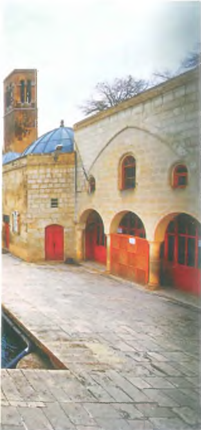
Halil-ür Rahman Gölü (Balıklıgöl) Halil-ür Rahman Lake (Balikli Gol)

According to the legend, the fire has been turned to water and the woods has been turned to fishes. It has been formed as a lake at the exact point where Abraham has fallen down and the surrounding of the lake has been turned to rose gardens. Regarding this legend, still today the fishes in the lake are considered as "holly" by the citizens and they're not allowed to be caught or eaten.