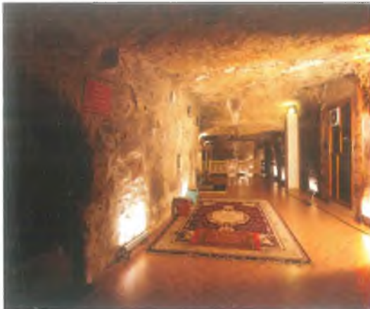
Mevlid-i Halil Mağarası / Mevlid-i Halil Cave

Meanwhile according to the legend, it’s been believed that Abraham was also miracally nursed by a gazelle by the order of God and within the 15 months he passed in the cave, it’s been believed that he has grown up to the age of 15.