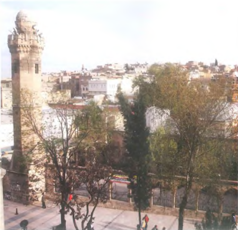
Hasan Padişah Camii / Sultan Hasan Mosque

Sultan Hasan Mosque was commissioned to be built by the Sultan Uzun-Hasan of Aq Qoyunlu(white sheep Turkomans) dynasty in the first half of 15th century. It's built just attached to Tok Temur Masjid of 14th century. There is a single shaft minaret in the north part of the courtyard and the water which comes from Halil-Ur Rahman Lake passes from this courtyard.