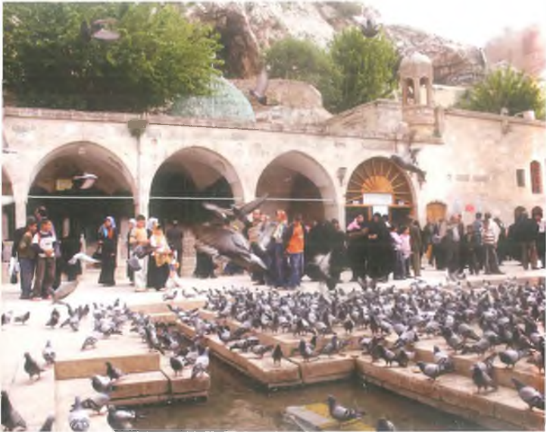
Mevlid-i Halil (Dergâh) Camii / Mevlid-i Halil Mosque