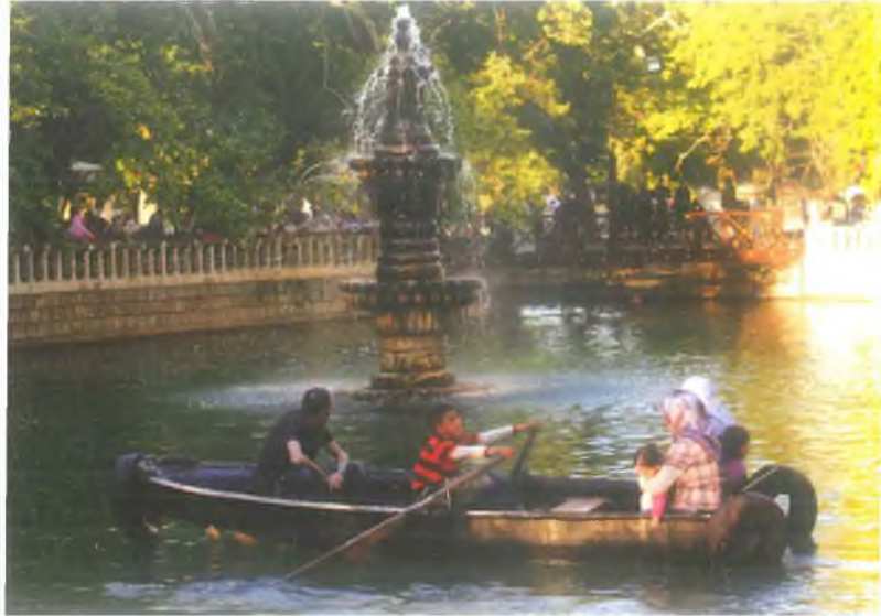
Aynzeliha Gölü / Aynzeliha Lake

Hız. İbrahim (a.s)'in ateşten kurtulma mucizesini gören Kralın kızı Zeliha, Hz. İbrahim'in davetini kabul ederek, babasının ilahlığını yüzüne karşı red eder. Öfkelenen Nemrut kendi eliyle kızını ateşe atar, Nemrud kendisine yakışır bir vaziyette kızının diri diri yanmasını ve ölümünü seyrederek. Zeliha'nın düştüğü yerde bir göl ve bu gölün içinde balıklar oluşur. O günden bu güne Zeliha'nın düştüğü yere Zeliha'nın Pınarı veya Zeliha'nı gözyaşı anlamında Aynzeliha Gölü denmektedir. Balıkların kutsal olduğuna inanıldığı için yenilmez.