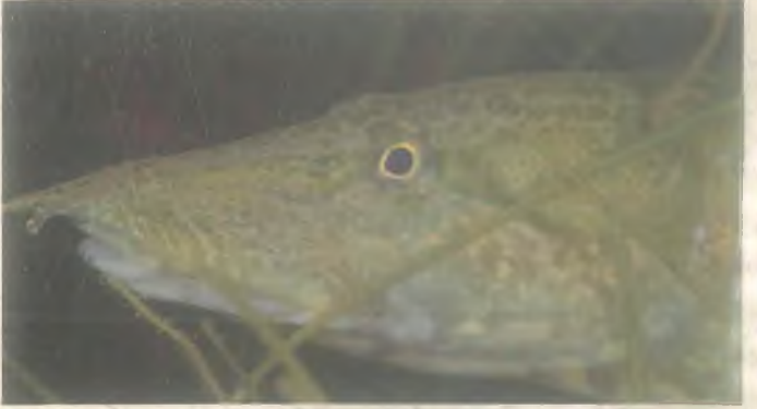
Dikenli Yılan Balığı (Mastacembelus mastacembelus )

Tatlısu İnci Kefali (Alburnus Mossulensis)