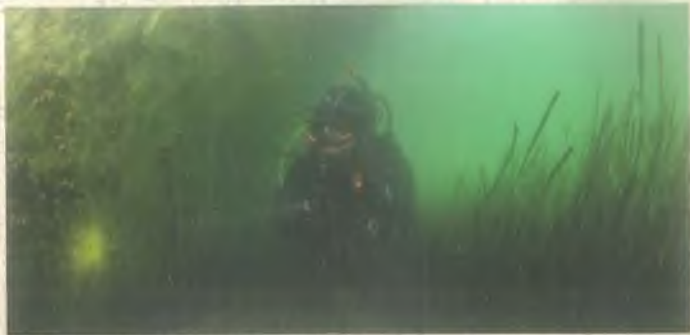
Eski Su Kanalları