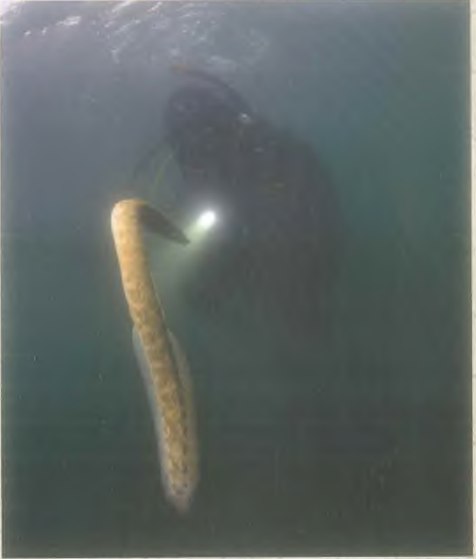
Yılan Balıkları ile Dans

Sualtinin en oyuncu canlılarından biri de dikenli yılan balığıdır. Ama dikenli yılan balığı ile sualtında yalnız Halfeti'de vakit geçirebilirsiniz. Eğer iyi anlaşırsanız el fenerinizin ışığında dakikalarca dans edebilir.