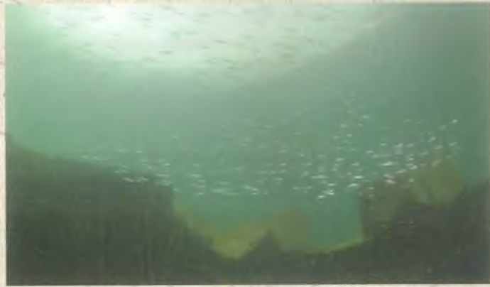
Tatlı Su İnci Kefali ( Alburnus Mossulensis )

Metinler: Nihat Özdal