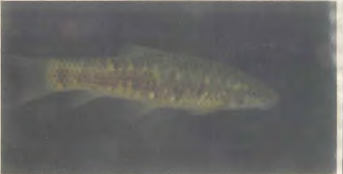
Kangal Balık (Garra Rufa)