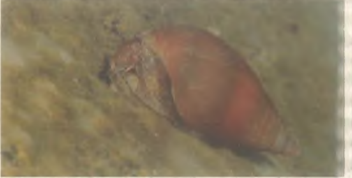
Tatlısu Salyangozu (Lymnaea Sp. )