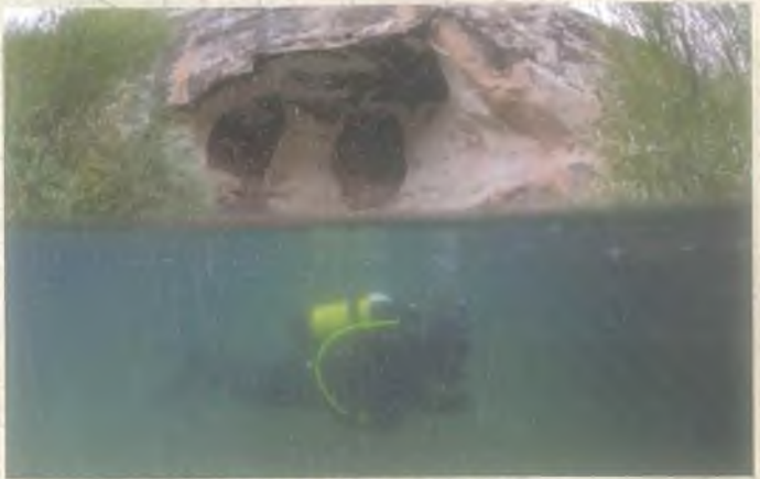
Ermeni Mağara Kilisesi