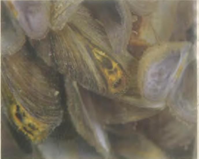
Tatlısu Midyesi (Dreissena Siouffi)