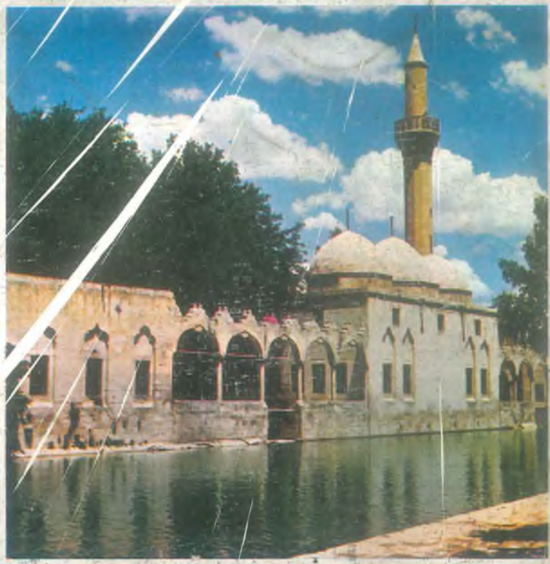
Halilü'r-rahman camii ve balıklı göl – URFA