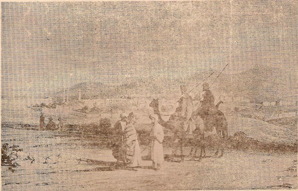
URFA'NIN GENEL GÖRÜNÜŞÜ

Bu iki gravür LIEUT - CHESNEY'in eserinden alınmıştır. (gravürler 1835 - 1837 yıllarını tesbit etmiştir.)